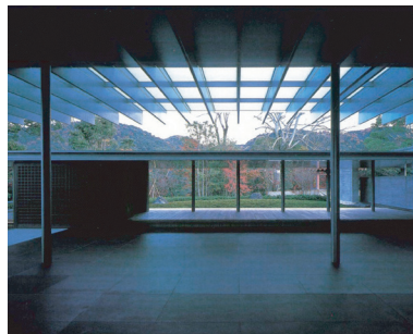
平等院宝物館「鳳翔館」