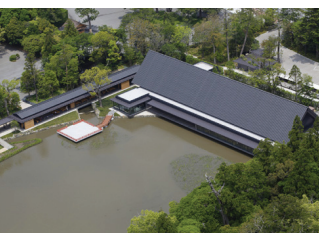
式年遷宮記念せんぐう館

15:40 第3部 ユニバーサルデザインの体験ができるショールームでバリアフリーの感覚体感