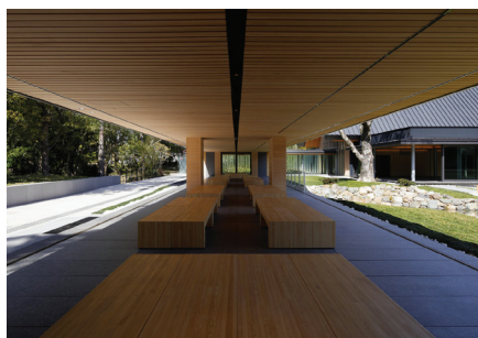
せんぐう館 フルオープン休憩所